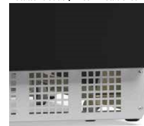
Detalle ruedas / Pies niveladores

Descongelamiento: Automático Iluminación: LED perimetral con interruptor Doble vidrios Low-E (bajo emisivo) con serigrafía Estantes regulables en vidrio templado: 3 niveles Puertas de acero inyectado con corrediza (interno acero inoxidable 430, externo Chapa prepintada) Base acoplada en Chapa prepintada negra, con paso de aire en Acero inoxidable 304 cepillado Pies niveladores y ruedas giratorias Vidrios templados sujetos a condensación